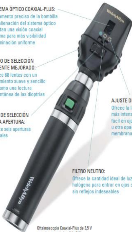
Oftalmoscopio Coaxial-Plus de 3,5 V con el mango de ion-litio 719

Ofrece la cantidad ideal de luz HPX™ halógena para entrar en ojos sanos sin reflejos indeseables