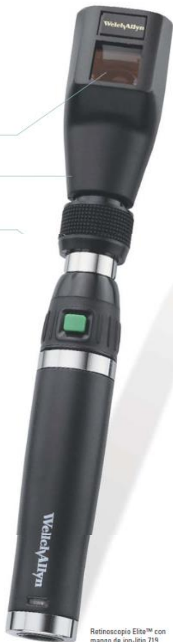
Retinoscopio Elite™ con mango de ion-litio 719

18250 Juego de cuatro tarjetas de fijación que se aplican fácil y rápidamente al logotipo imantado en el cabezal del instrumento para una retinoscopia dinámica.