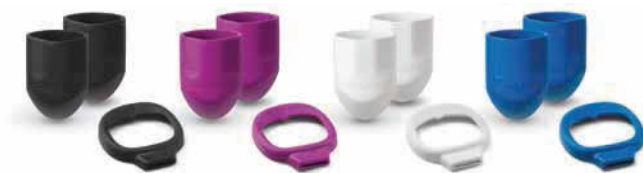
Protectores para mango y ventana

Puede ser personalizado usando el kit de accesorios* para que se adapte a su estilo.