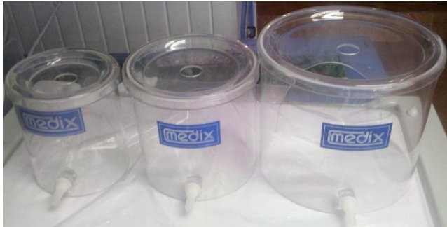
3 TAMAÑOS DIFERENTES